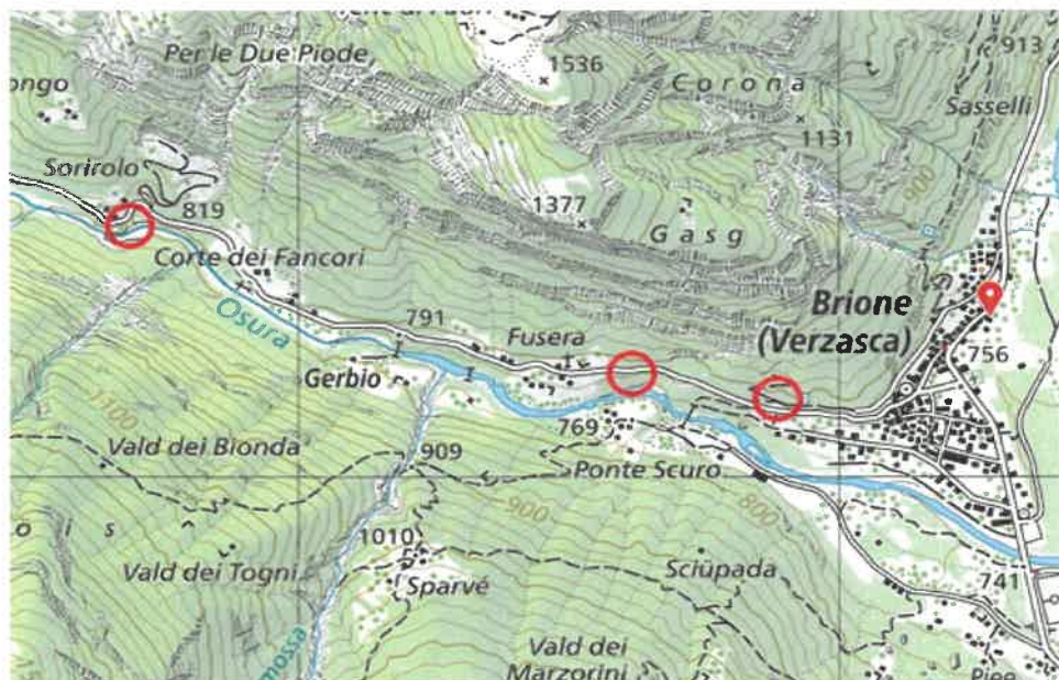
Punti evidenziali (circolo rosso) sull'estratto della carta nazionale.

Nell'insieme, il risanamento qui proposto interessa ca. 23 ml di ciglio stradale, con la formazione di muri di contenimento, comprensivo di scavi parziali, movimenti di terra, ripristino della barriera di protezione esistente e della pavimentazione stradale.